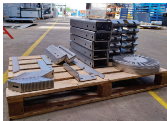
Découpe et pliage de pièces acier.

Démantèlement et assemblage d'installations industrielles, montage mécanique, chaudronnerie et métallerie, travaux d'électricité, électromécanique et instrumentation, maintenance industrielle et logistique de chantier : autant d'opérations que le Groupe Sylann peut prendre en charge, en France comme en Europe.