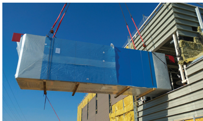
Manutention d'un tunnel de 6,5 t.